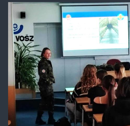
Přednáška žáky velmi zaujala