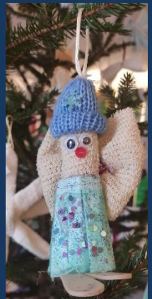
Zuzana Vildmanová, 3 ZDL

Tímto paním učitelkám děkujeme, že nám tuto návštěvu umožnily.