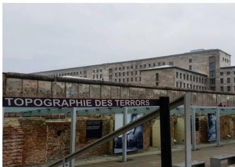
▲ Historické muzeum Topografie teroru