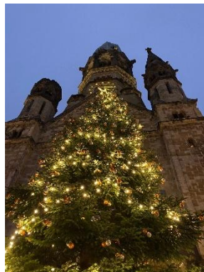
Vánoční trhy v centru Berlína