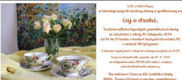
Připravila: Ing. Jaroslava Michálková