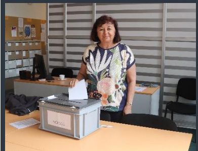
Voleb se zúčastnila rovněž paní ředitelka

Nyní čekáme na jmenování členů za zřizovatele, aby se od června nová školská rada mohla ujmout svých povinností.