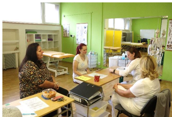
Praktické maturitní zkoušky u oborů Asistent zubní technika a Masér sportovní a rekondiční