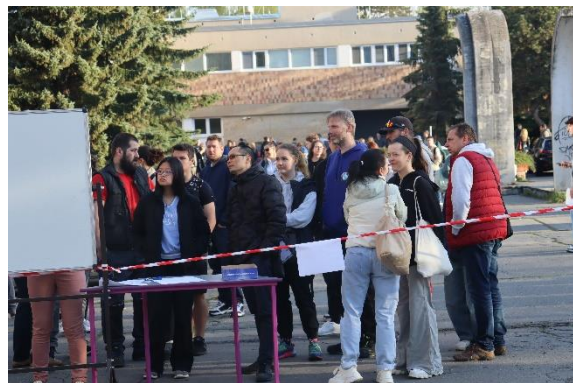
Řady uchazečů se v pátek 12. dubna scházely před naší školou již okolo půl osmé