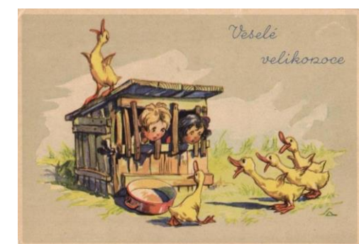
Motivy velikonočních pohlednic jsou si podobné – děti, vajíčka, kuřata, housata, ovečky, zajíčky...