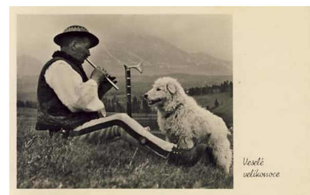
▲ Černobilá fotografie je mezi starými pohledy vzácností