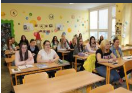
Výuka studentů oboru Sociální práce

Novinkou je otevření kombinované formy u oboru Sociální práce a sociální pedagogika – kód oboru: 75-32- N/..