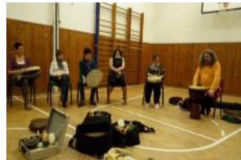
Večer se zážitkovou muzikoterapií