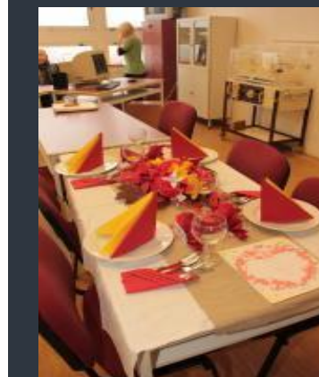
Nejzdařilejší prostření: Svatba na podzim