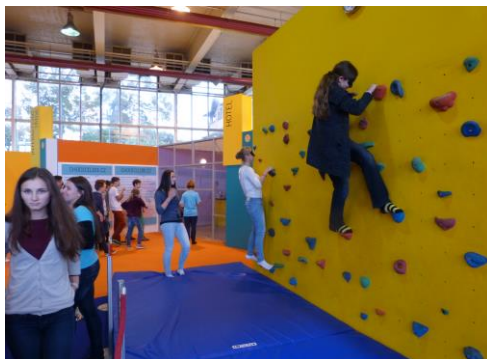
Lezení po stěně bez použití nejdůležitějšího smyslu, zraku, vyžaduje mnoho fyzických i psychických sil