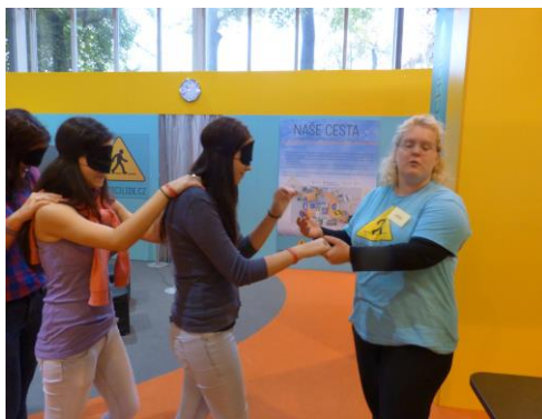
Chůze naslepo v neznámém prostředí, to je dilema: Kam asi šlápnu?