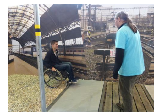
Vyjet na invalidním vozíku do kopečka, který byl samý kámen, bylo náročné i pro kluky