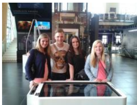
Třída 3B ZA navštívila Techmání