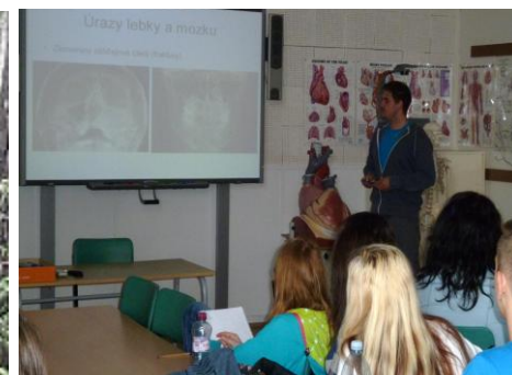
Přednášky na Fakultě zdravotnických studií ZČU na témata První pomoc, Bezpečný žák, Úrazy v RTG obrazech a Ochrana před zářením vyslechli žáci tříd 1B ZA, 2 ZDL, 3B ZA, 3 LAA, 1A ZA, 2A ZA a 2B ZA

Připravily: Mgr. Jaroslava Opatrná a Ing. Jaroslava Michálková, foto: žáci a vyučující jednotlivých tříd