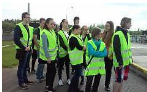
Třída 1 LAA se zúčastnila exkurze na čistítku odpadních vod v Plzni