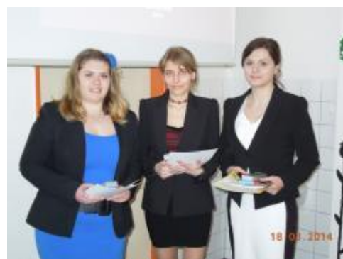
A druhé místo obsadily...