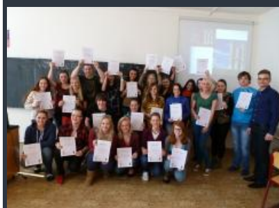
V článku použito materiálů a fotografií kolegyně Mgr. J. Opatrné