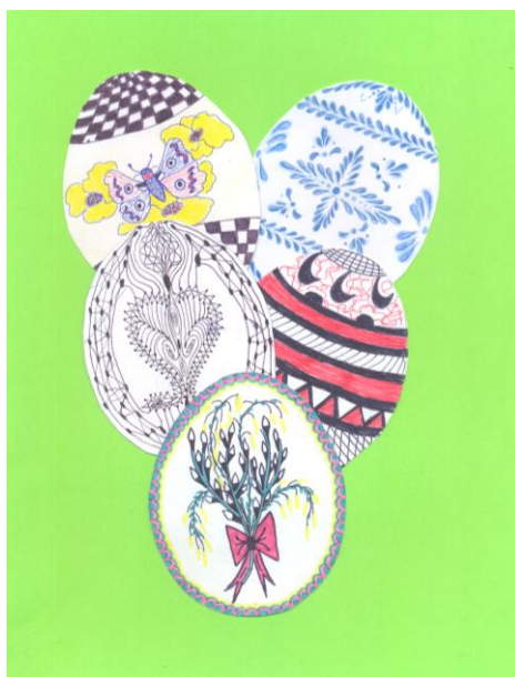
Motiv „Duben“ pro školní kalendář vytvořili žáci třídy 2A ZA

Velkonoce, Velkonoce, kdes tak dlouho bula? Hu studánky, hu studánky, nohy sem si myjla. Smrt jede po vodě, bílý léto k nám veze. Jakej je to mazanec bez koření, bez vajec. Ha ty svatá Markýto, dej nám pozor na žito, na to všecko obilí, co nám Pán Bůh nadělí.