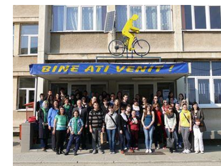
Návštěva partnerské školy v Sibiu