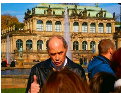
V článku použito materiálů kolegy F. Slováčka