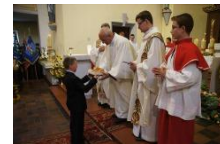
Dožínková slavnost v Polsku – mše v kostele v Tarnowskich Gorach