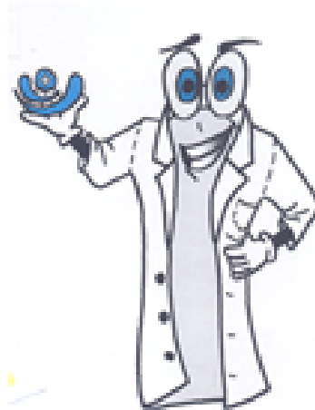
1. místo Michaela Směšná 1 DNT LÉKAŘSKÝ PLÁŠŤ

„Sova je proslavená svojí inteligencí a moudrostí. Její velké oči dobře vidí všechny bolesti lidí a zvířat. Pro mě je sova symbolem zdravotnictví.“