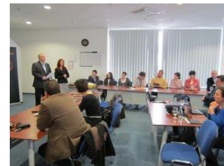
Z konference – obrázek převzat z místního deníku Tribuna ze dne 26.4.2013