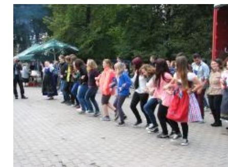
Dožínková slavnost v Polsku – lidový tanec troják