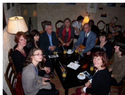
V článku použito materiálů a fotografií kolegy J. Smazala